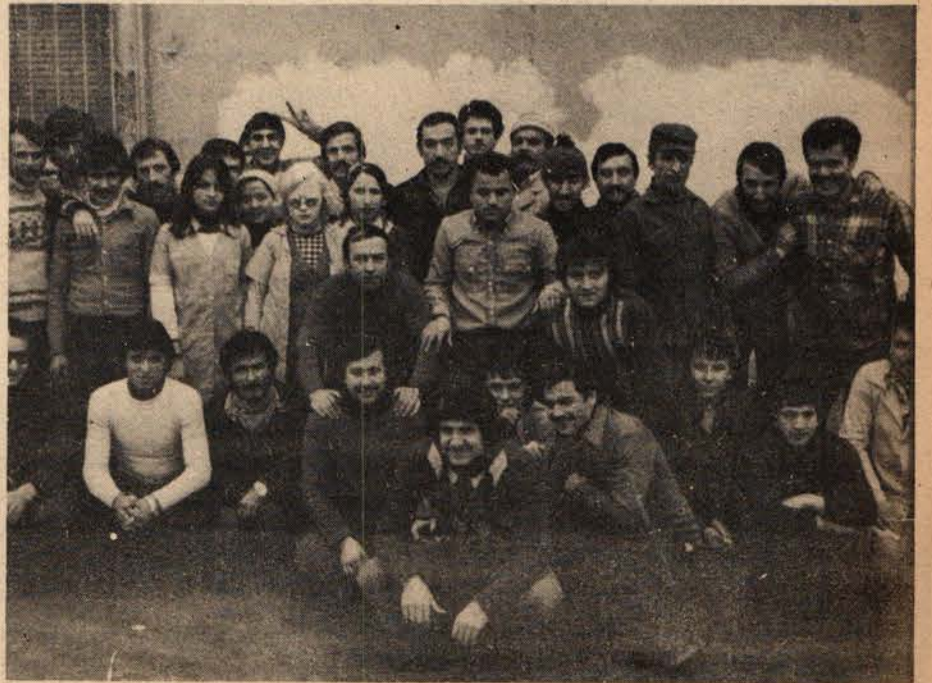
Dörter Matbaası işçileri toplu halde

İşverenin bu şekilde gerilemesi sonucu toplu sözleşme görüşmelerine yeniden başlanmıştır.