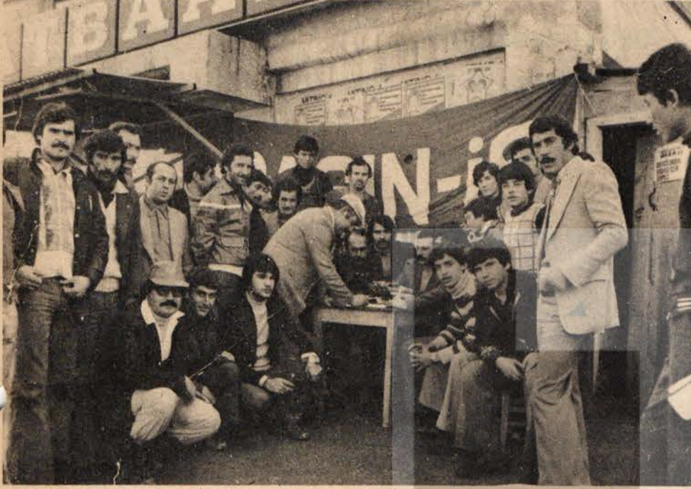
3. Ayını dolduran Grevci Kemal Matbaası işçileri